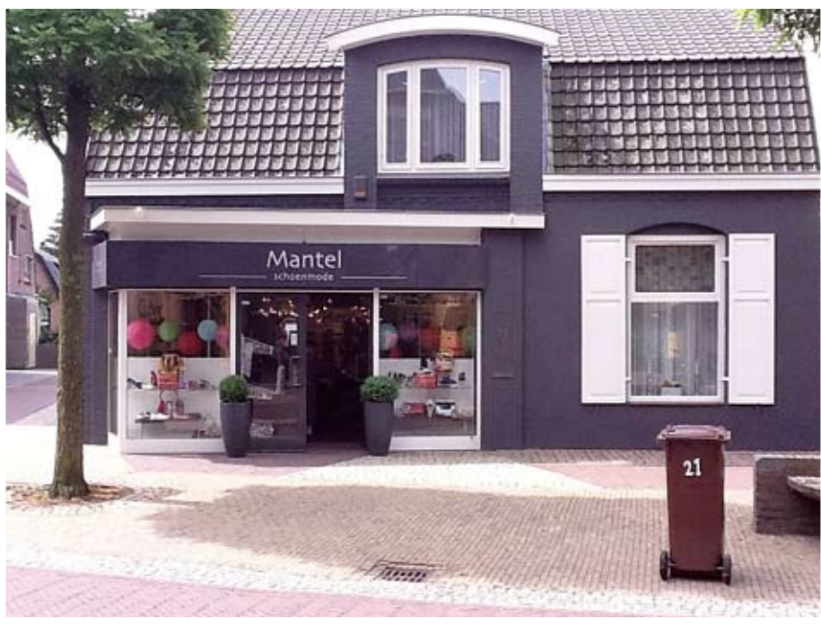
Mantel Schoenmode in Doorn heeft al een Marktscan+ laten uitvoeren.